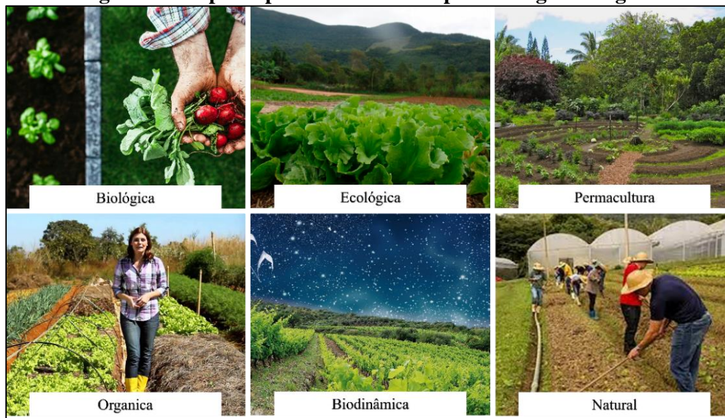
Figura 2 - Os princípios das diferentes práticas agroecológicas